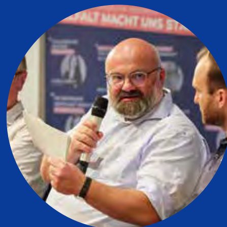
Sascha Thümmler Die Grünen