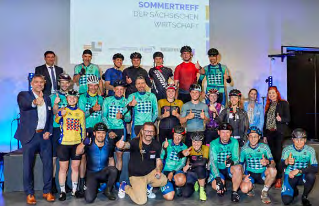
Die Fahrer des European Peace Ride legten während ihrer Trainingsrunde einen Zwischenstopp beim Sommertreff ein.